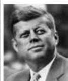
Kennedy maladie d' Adisson