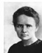
Marie Curie an mie aplasique (grave maladie de la moelle osseuse)