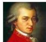
Mozart syndrome Gilles de la Tourette