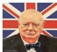
Winston Churchill b gue