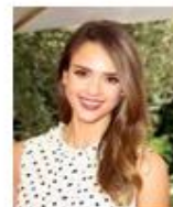
Jessica Alba TOC