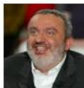
Dominique Farrugia scl rose en plaque