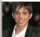
Gr gory Lemarchal mucoviscidose